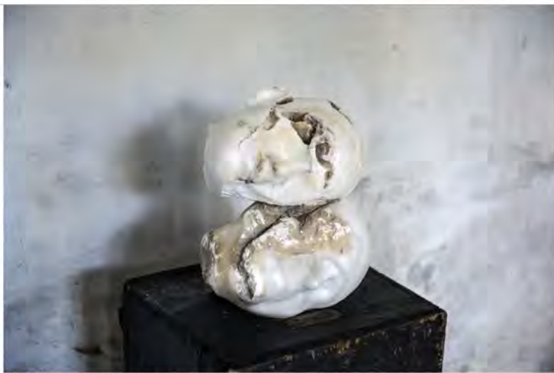
AL/XXXXVI/17, een albasten dubbelportret voor de expo 'Ecce Homo'.

Sofie Muller (43) volgde in Antwerpen een opleiding als schilder. Ze werd er getraind in modeltekenen, maar ontdekte al snel dat beelden en installaties meer haar ding waren. Vijftien jaar geleden dook ze uit niets op met gepateneerde bronzen sculpturen, vaak kindportretten. Later waren er ensembles van te zien, onder meer op de Poëziezomer van Watou en in C-Mine in Genk (beide 2012). Ze tonen broze, in zichzelf gekeerde figuren die in de knoop lig-