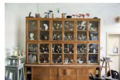
Links: een vroege versie van Tristan (2007). Rechts: Vitriekast met werkmodellen, geboetsed in plasticine en bewerkt met kaarsroet.